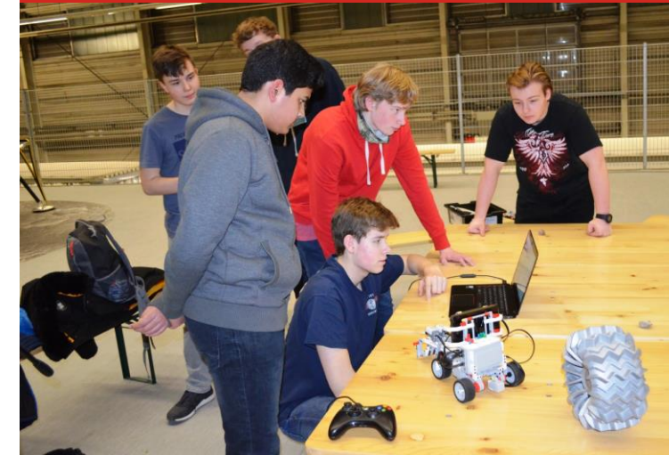
Rovertest bei PTS